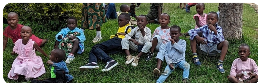
Niños de Ruanda.

Oremos por África, su población y su liderazgo. Que Dios les conceda paz.