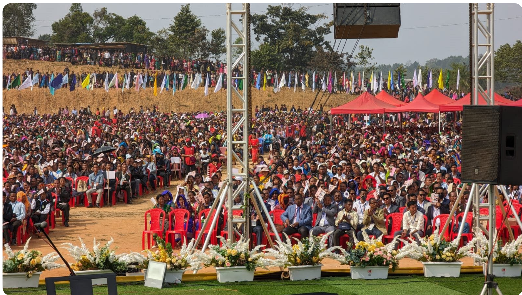
La multitud asistente al 150 Aniversario de la Presencia Bautista en Garo.